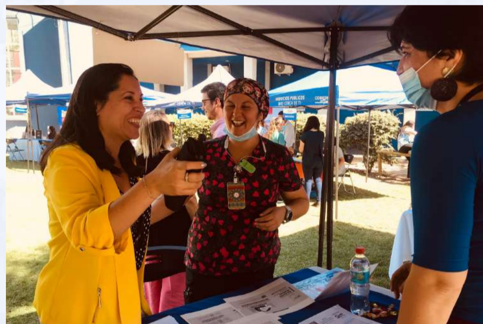
Gobierno en Terreno Hospital Sótero del Río