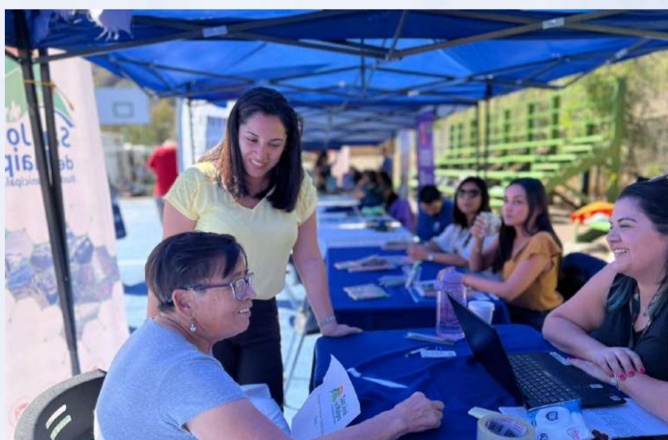
Gobierno en Terreno en San José de Maipo