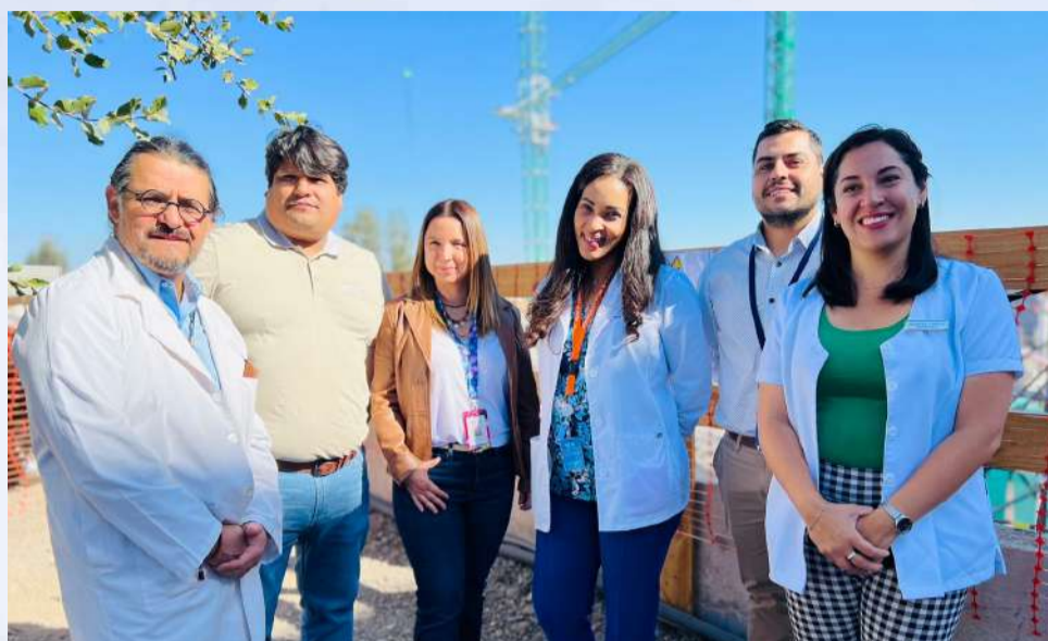
Delegada presidencial visitó avance de obras en Hospital CRS Cordillera