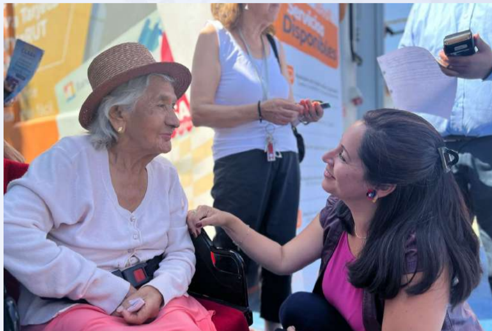
Diálogo permanente con nuestra comunidad.